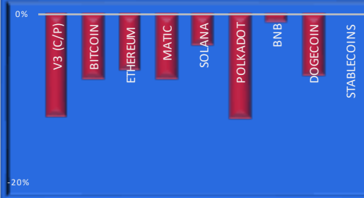
TABLA DE PERFORMANCE